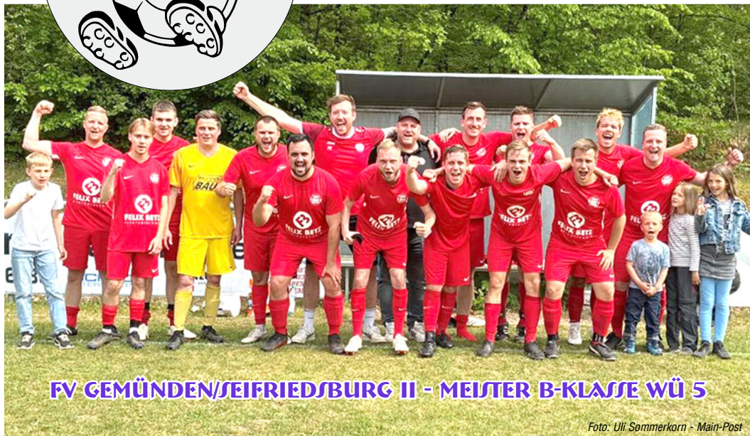
FV GEMÜNDEN/SEIFRIEDSBURG II - MEISTER B-KLASSE WÜ 5